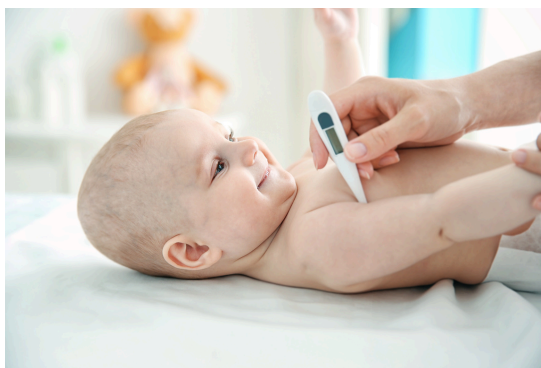
Prise de température axillaire

La prise de température buccale ou frontale n'est pas recommandée. Il n'est pas recommandé non plus de prendre la température rectale, pour éviter de blesser l'enfant.